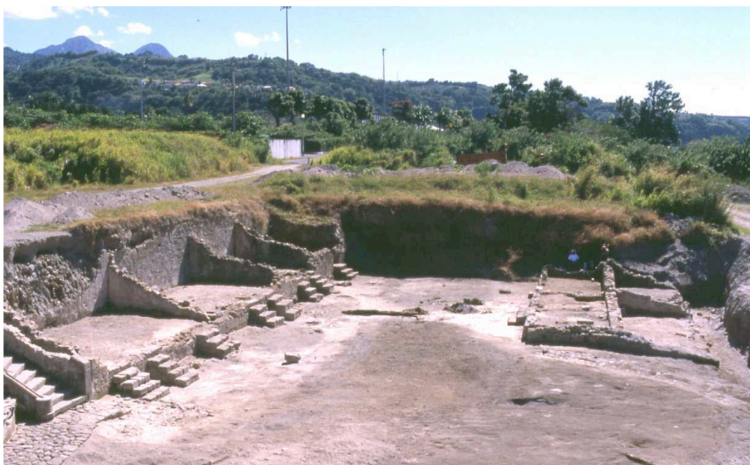
Figure 6 : Vue du village d'esclaves du Château Perrinelle en cours de fouille.