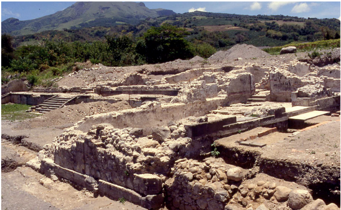
Figure 5 : Vue de la fouille du Château Perrinelle.