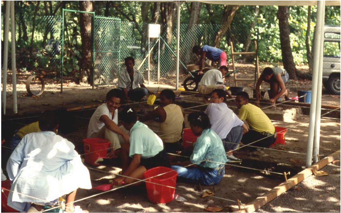
Figure 2 : Vue du site de Dizac en cours de fouille (cliché C. Leton).