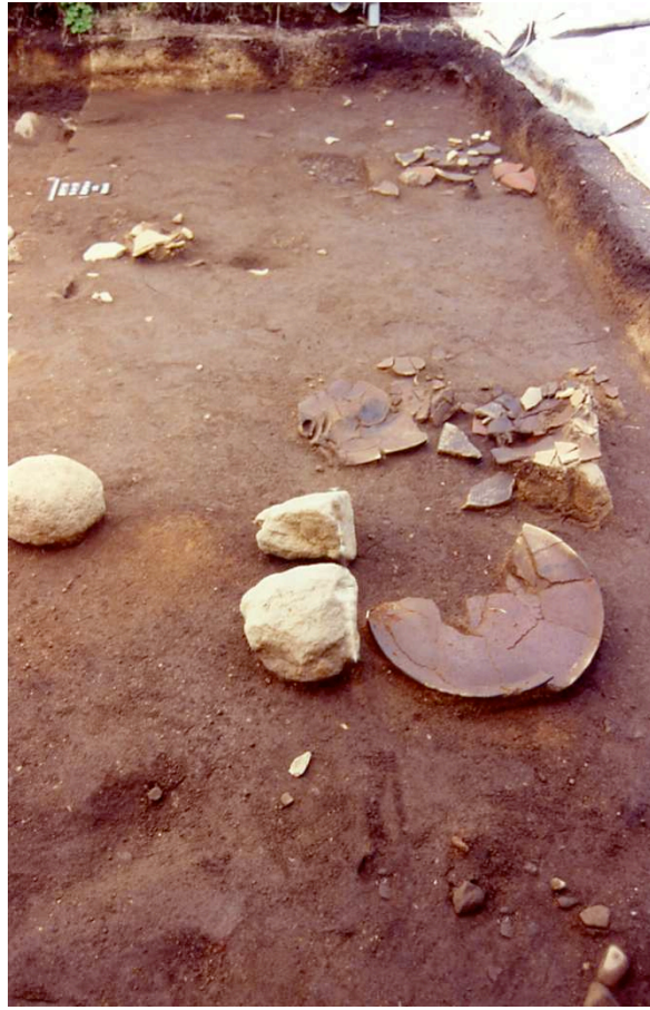
Figure 4 : Vue du niveau d'abandon du site de Vivé, (cliché B. Bérard)