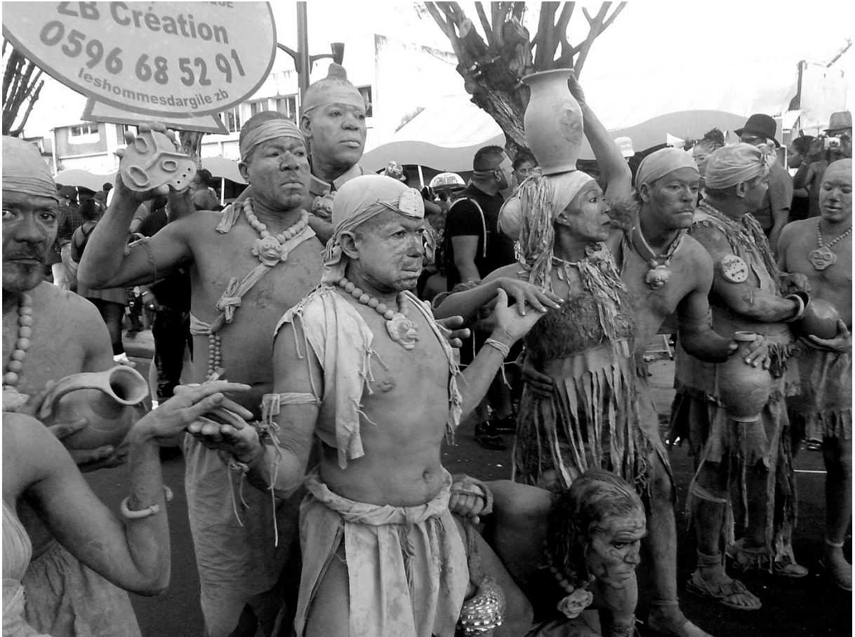
Figure 4 – Ré-utilisation de motifs amérindiens par les hommes d'argiles, carnaval 2014, Fort-de-France.

En dehors des arts plastiques, ce mouvement vient aussi irriguer des expériences artistiques et politiques, comme LaKouZemi , conçue par Monchoachi 22 ou la production de groupes carnavalesques, tels Voukoum et son Mas-a-Roukou en Guadeloupe ou les hommes d'argile en Martinique.