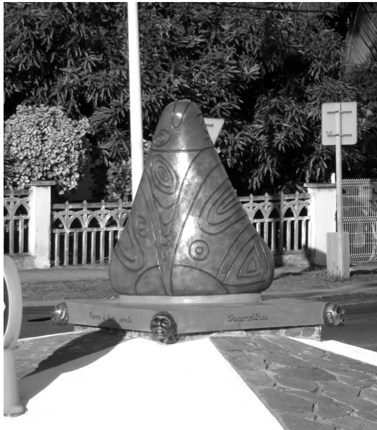
Figure 2 – Œuvre d'un artiste cubain installée sur un rond-point à l'entrée de la commune du Marin (Martinique) en 2013 dans le cadre de l'année Césaire

Cette extension est clairement visible dans la constellation d'initiatives privées ou publiques, plus ou moins réussies, qui viennent compléter ces grands projets structurants. Il s'agit principalement de petites expositions, de reconstitutions ou de productions artisanales d'inspiration amérindienne.