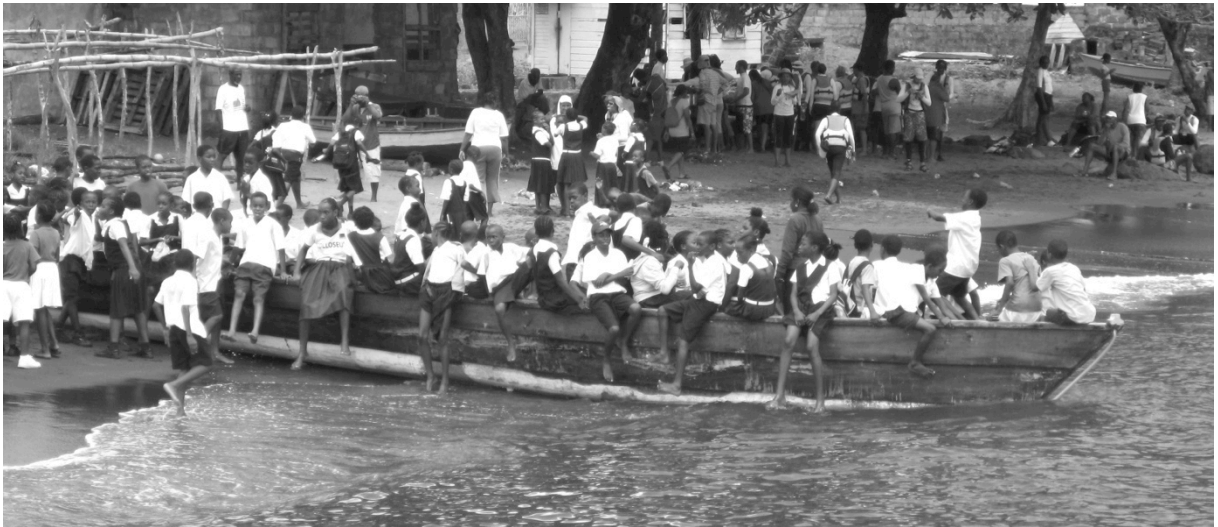
Figure 5 – "Adoption" de la kanawa « Akayouman » par les écoliers de Baroualie (Saint-Vincent) lors de l'expédition Grenade/Martinique de l'association Karisko