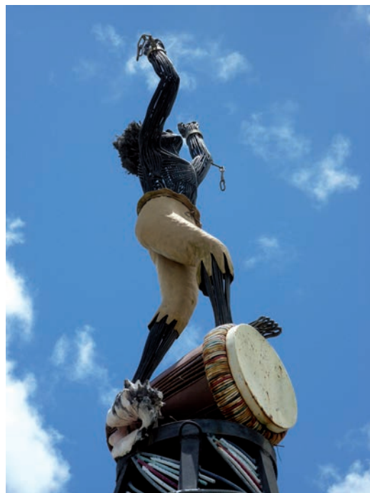
« L'esclave libéré » Michel Glondu, 2002, cliché B. Béral.