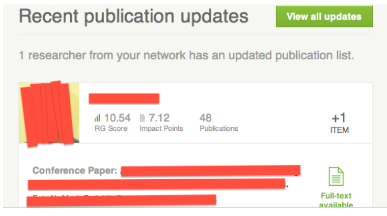
Figure 4 : Annonce d'une nouvelle publication

De cette manière, le dispositif impose aux utilisateurs/chercheurs une grille d'évaluation basée sur le calcul, les données statistiques et la logique computationnelle du numérique. En accord avec la logique de la « web science », la qualité des chercheurs est évaluée à partir de données quantifiables, trouvées sur le web qui peuvent être traitées statistiquement. Ainsi, le dispositif