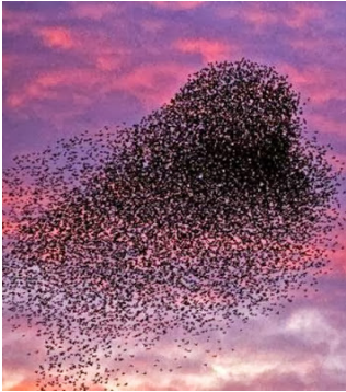
Fig 1 Vol d'étourneaux