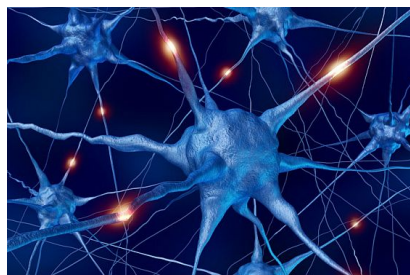
Fig 7 Microprocesseur IBM http://www.itp.net/mobile/585872-ibm-develops-electronic-brain

En produisant ces premières « puces cérébrales », les scientifiques de cette firme tendent à reproduire le cerveau humain. 11 Ils estiment que ces ordinateurs cognitifs pourraient être utilisés pour l'analyse du comportement de nos semblables et la surveillance de l'environnement.