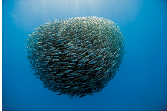
Fig 2 Banc de poissons

Ces phénomènes d'auto-organisation observés dans le règne animal se retrouvent dans certaines circonstances dans les sociétés humaines. Dans les grands rassemblements de foule (manifestations de rue, rencontres sportives, concerts...), on peut observer que les salves d'applaudissements, les déplacements, les gestuelles collectives n'ont ni leader, ni centre organisateur, ni programmation et ne sont pas le résultat d'un projet global 6 . Ils se comportent comme des systèmes critiques complexes.