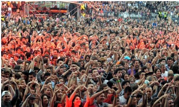
Fig 3. Fête de la musique à Carcassonne

Ces phénomènes d'auto-organisation observés dans le règne animal se retrouvent dans certaines circonstances dans les sociétés humaines. Dans les grands rassemblements de foule (manifestations de rue, rencontres sportives, concerts...), on peut observer que les salves d'applaudissements, les déplacements, les gestuelles collectives n'ont ni leader, ni centre organisateur, ni programmation et ne sont pas le résultat d'un projet global 6 . Ils se comportent comme des systèmes critiques complexes.