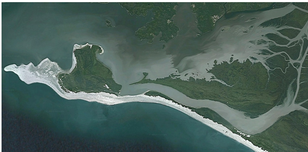
Figure 6. L'île du Diable (Chili)