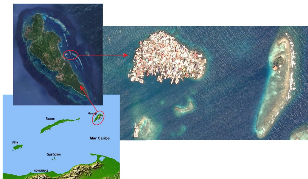
Figure 1. Des îles, entre méconnaissance et oubli : l'exemple de Cay Pond (îles de la Baie, Honduras)