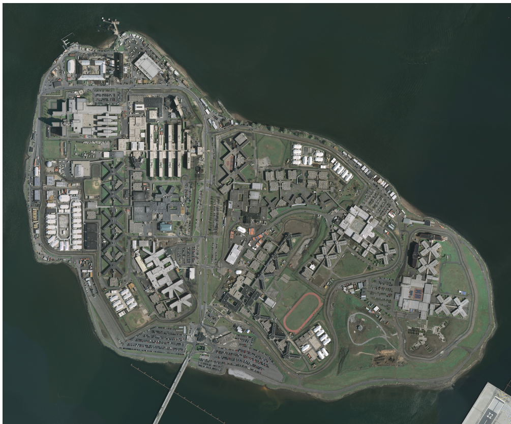
Figure 2. L'île-prison de Rikers Island (New York, Etats-Unis) : un modèle d'optimisation d'un espace insulaire (11 000 agents et civils pour une capacité maximale de 17 000 détenus, sur 1,672 km 2 )