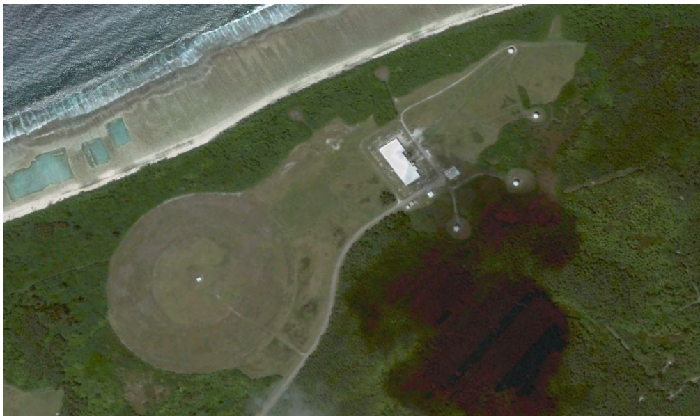
4.d. Le système de surveillance spatiale électro-optique (Ground-Based Elctro-Optical Deep Space Surveillance System [GEODSS]) ; l'un des trois sites opérationnels dans le monde.