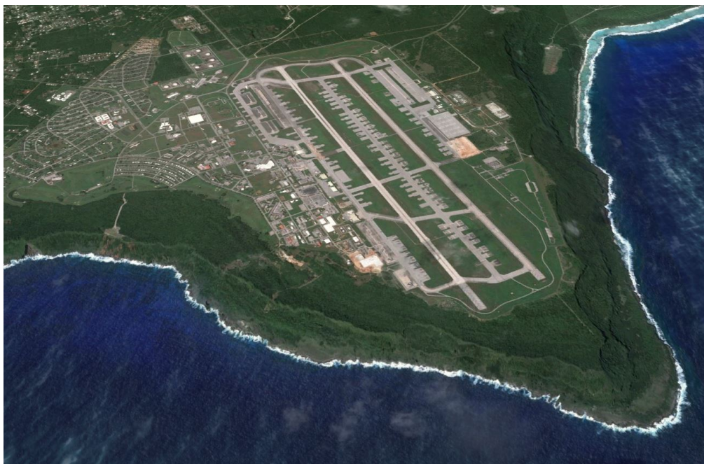
Figure 5. Guam (Andersen Air Force Base), la rente géostratégique d'une île porte-avions