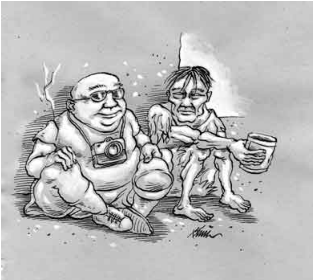
Illustration 3b. Tourisme et pauvreté : repenser ses rapports à l'Autre