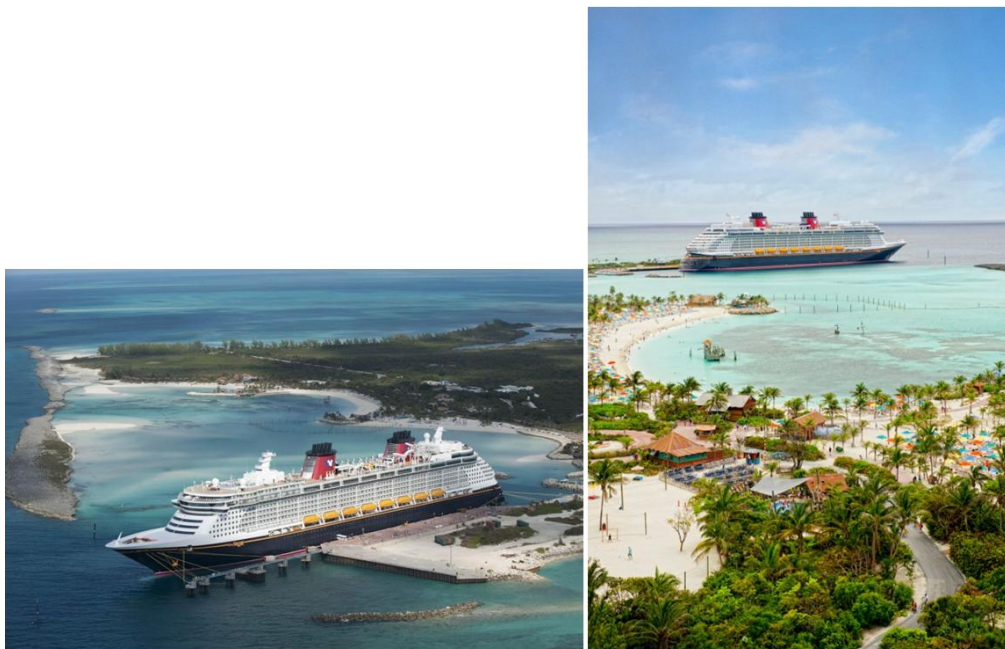
Photographies 3a et 3b. L'île privée de Castaway (Bahamas) réservée aux clients de Disney Cruise Line.