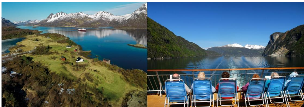
Photographies 1a et 1b. La croisière est un resort flottant qui défile au milieu des paysages de cartes postales.