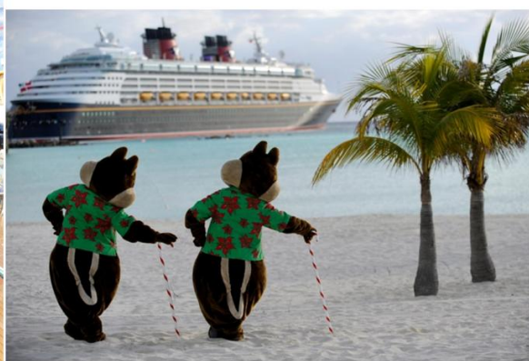
Photographies 2a et 2b.

Walt Disney se lance dans le monde la croisière avec Disney Cruise Line.