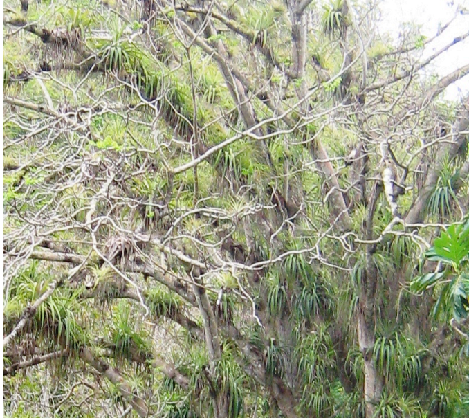
Figure 1.a - Arbre colonisé par des ananas bois. Route de Port-Blanc Gosier (mai 2008)

particulière du croissant par rapport à une représentation verticale d'un croissant de Lune. L'élève est alors sollicité pour construire une explication validant son observation, en s'appuyant sur le modèle précédemment utilisé.