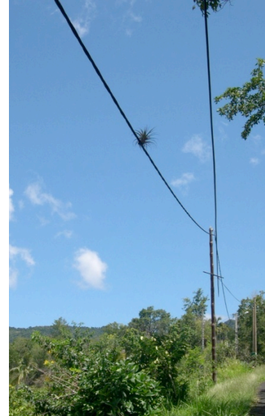
Figure 1.c - Ananas bois poussant sur un fil électrique. Vieux-Habitants (mai 2008)