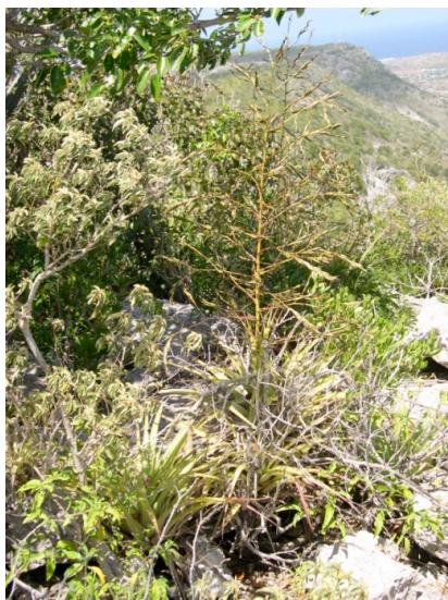
Figure 1.b - Ananas bois poussant sur des branches de bois mort. Désirade (mai 2008)