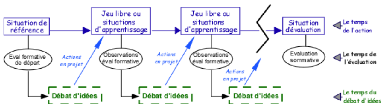
Figure 1. Modélisation d'un cycle d'enseignement (Gréhaigne & Godbout, 1998).

Si le professeur désire faire un apport dans le débat d'idées, son intervention doit être brève et concise pour éviter de trop parachuter des solutions toutes faites. Dans le cas de situations d'apprentissage, l'enseignant peut proposer aux élèves différents types de tâches :