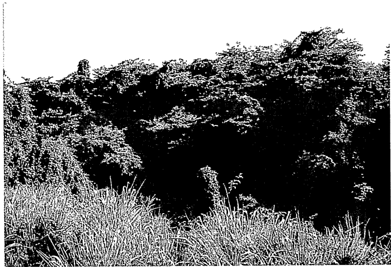
Forêt marécageuse à P. officinalis en Guadeloupe : lisière stable recouverte d'un rideau de lianes. P. officinalis swamp forest in Guadeloupe : stable forest edge covered with vines.

De manière générale, les gaulis et les plantules occupent les zones les moins inondées du sous-bois et, en particulier, les monticules de litière accumulée au pied des arbres adultes. Dans ces milieux on rencontre, en outre, des fougères, des lianes et des épiphytes en abondance, la présence des unes ou des autres dépendant du degré d'ouverture de la canopée. Les épiphytes sont plutôt présentes dans les forêts jeunes (canopée ouverte). Ailleurs, on rencontre parfois de grandes lianes ligneuses. La surface terrière moyenne dans les cinq forêts étudiées par ALVAREZ-LOPEZ varie de 27,7 à 55 m 2 /ha (toutes espèces ayant un diamètre supérieur à 2,5 cm confondues). La densité de tiges est comprise entre 950 et 1 910 arbres et arbustes/ha. Les valeurs de production de litière dans les forêts côtières vont de 8,7 à 14,1 t/ha/an. La biomasse racinaire est ici principalement localisée