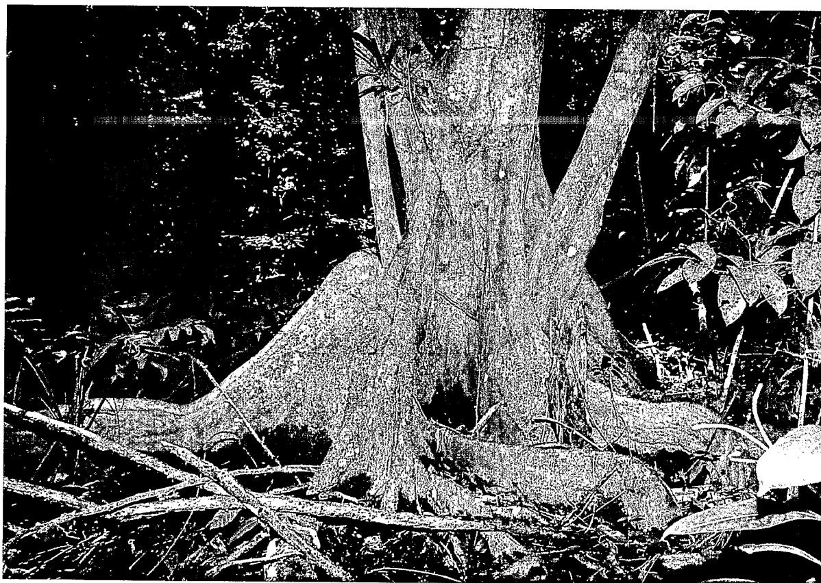
Agrégation de plusieurs individus de P. officinalis avec leurs contreforts racinaires. A clump of several P. officinalis trees with their buttress roots.