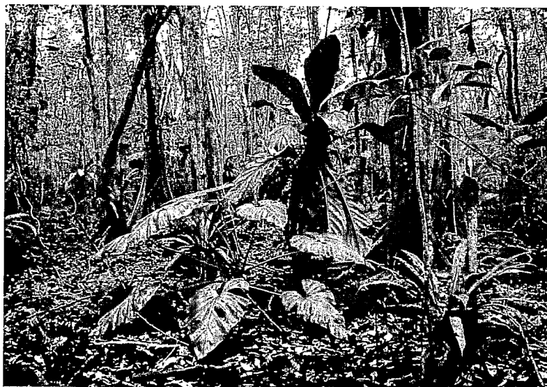
Exemples d'espèces épiphytes : Philodendron giganteum (gauche), Anthurium acaule (centre), Asplenium serratum (droite). Examples of epiphytic plants : Philodendron giganteum (left), Anthurium acaule (centre), Asplenium serratum (right).

A côté d'un cortège floristique commun à l'ensemble des peuplements, marqué par l'omniprésence de P. officinalis et de la liane Hippocratea volubilis , un cortège particulier à chaque type forestier a été identifié (cf. tableau ci-contre). Au total 178 espèces végétales (Phanérogames et Ptéridophytes) ont été dénombrées, dont 45 % de phanérophtes (arbres et arbrisseaux), 26 % d'herbacées terrestres, 17 % de lianes et 12 % d'épiphytes (IMBERT et al. , 1997). Selon le type forestier, on dénombre entre 13 et 37 espèces pour 400 m 2 . Les familles les mieux représentées sont celle des Polypodiées (Fougères) avec 17 espèces,