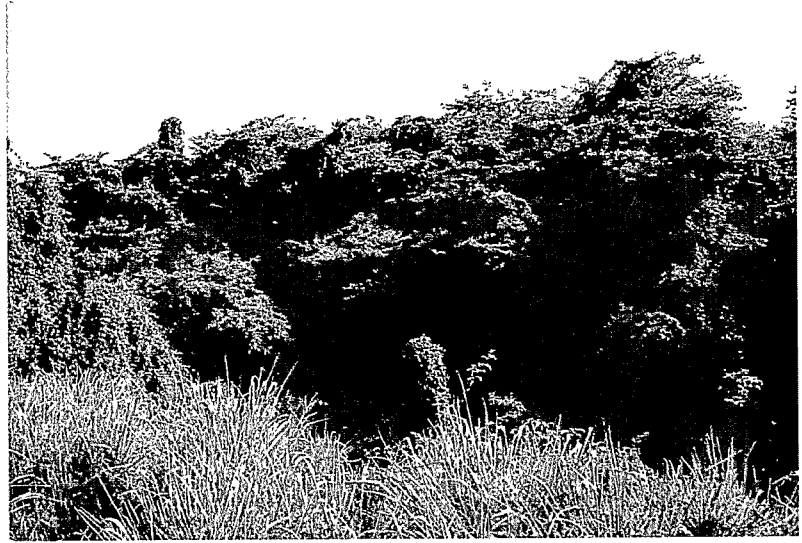
Forêt marécageuse à P. officinalis en Guadeloupe : lisière stable recouverte d'un rideau de lianes. P. officinalis swamp forest in Guadeloupe : stable forest edge covered with vines.

De manière générale, les gaulis et les plantules occupent les zones les moins inondées du sous-bois et, en particulier, les monticules de litière accumulée au pied des arbres adultes. Dans ces milieux on rencontre, en outre, des fougères, des lianes et des épiphytes en abondance, la présence des unes ou des autres dépendant du degré d'ouverture de la canopée. Les épiphytes sont plutôt présentes dans les forêts jeunes (canopée ouverte). Ailleurs, on rencontre parfois de grandes lianes ligneuses. La surface terrière moyenne dans les cinq forêts étudiées par ALVAREZ-LOPEZ varie de 27,7 à 55 m 2 /ha (toutes espèces ayant un diamètre supérieur à 2,5 cm confondues). La densité de tiges est comprise entre 950 et 1 910 arbres et arbustes/ha. Les valeurs de production de litière dans les forêts côtières vont de 8,7 à 14,1 t/ha/an. La biomasse racinaire est ici principalement localisée