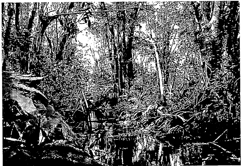
Vue générale d'un sous-bois traversé par un ancien chenal d'eau douce. General view of an underwood with an old freshwater channel running through it.

Toutes les espèces du genre Pterocarpus sont arborescentes. Le genre comprendrait 20 espèces selon HOWARD (1988), distribuées à travers les tropiques, notamment en Afrique Centrale et dans l'archipel malais. La plupart d'entre elles sont inféodées aux milieux humides.