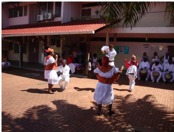
Ex. 5. Quelques pas de nika , jeunes danseurs groupe Wapa, 2012.

Par les différents nika (ex. 5), chaque danseur marque de sa personne une identité et une esthétique musico-chorégraphiques qui apportent dynamique et vie au kasékò .