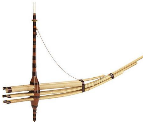
Ex. 3. L'orgue à bouche qeej , 2011. Cet aérophone appartient à M. René Lau Fai Neek, du village Cacao.

Pour évoquer cette réalité, la musique du qeej me servira d'illustration. Cet orgue à bouche est, par ailleurs, l'instrument de musique hmong par excellence (ex. 3).