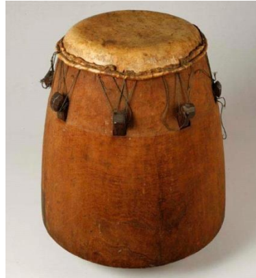
Ex. 4. Apinti doon (tambour apinti ), photographié en 2007 à l'occasion d'une levée de deuil ( puu baaka ), à Loka.

instruments de musique, dont je relève ici des caractéristiques spécifiques qui relient les Bushinenge à leurs environnements spirituel et naturel. Il s'agit surtout de trois tambours traditionnels ( gaan doon , pikin doon et tun : grand tambour, petit tambour et tambour-métronome), qui servent aux usages cérémoniels ou rituels, en particulier pour des cérémonies de deuil ou des prières spécifiquement destinées aux ancêtres et aux divinités. Ces instruments accompagnent également toutes sortes de chants et danses. À l'intérieur de ce trio tambourinaire, le gaan doon sert de tambour-maître. Il joue le solo avec des parties improvisées. Dans le contexte des cérémonies rituelles liées à des prières aux ancêtres ou aux divinités, ce tambour change de dénomination et devient alors tambour apinti ou apinti doon (ex. 4).