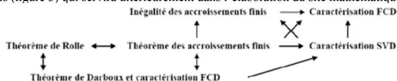
Figure 3 : le réseau des relations entre les principaux énoncés étudiés

Les caractérisations FCD et SVD s'insèrent dans ce diagramme pour former le réseau des relations entre ces différents énoncés (figure 3) qui servira ultérieurement dans l'élaboration du site mathématique de la question.