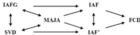
Figure 1 4 : relations entre différentes propriétés d'accroissements finis

A ce stade, nous avons obtenu les relations entre les différentes formes de propriétés d'accroissements finis résumées dans le diagramme de la figure 1 3 . Nous avons choisi de mettre en évidence la propriété MAJA, moins souvent utilisée