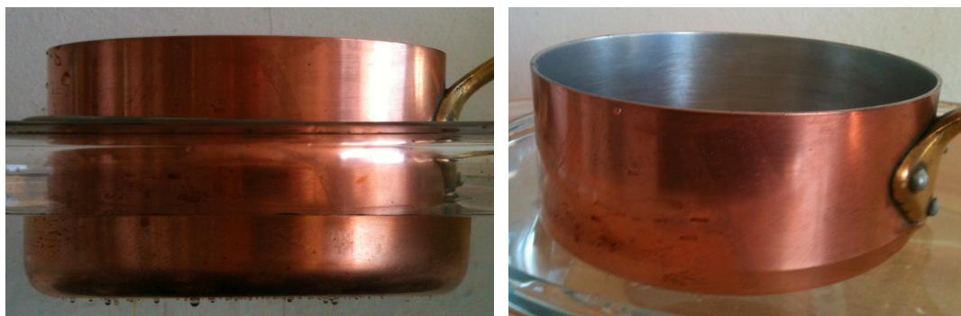
Figure 3 : casseroles dans de l'eau

Ces deux casseroles (figure 3) ont été mises dans un bac d'eau, manifestement l'une « flotte moins bien »... pourtant elles sont faites du même matériau, de même épaisseur (du cuivre). D'où vient la différence ?