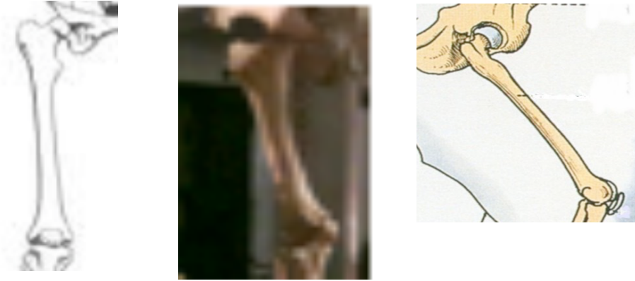
Figure 2 : les fémurs

Si en effet nous voulons comparer les trois squelettes en agrandissant les plus petits à la taille de celui de l'éléphant, alors nous obtenons ceci : les os de l'éléphant sont bien plus massifs que ceux de l'homme, qui semblent eux-mêmes plus massifs que ceux du chat, ce que l'on observe en comparant par exemple le fémur. Voici un fémur humain, un fémur d'éléphant et un fémur de chat (figure 2), dont on peut tenter de comparer le rapport longueur/section en mesurant sur les photos à l'échelle le diamètre (d'où la section s = \pi \cdot d^2 / 4 ) et la longueur.