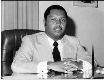
Jean-Claude Duvalier à Port-au-Prince en 1982

travers les tournées mondiales des troupes folkloriques privées et celles de la Troupe Folklorique Nationale, soit avec les voodoo shows produits dans les hôtels, Haïti connaissait alors un essor important du tourisme 2 .