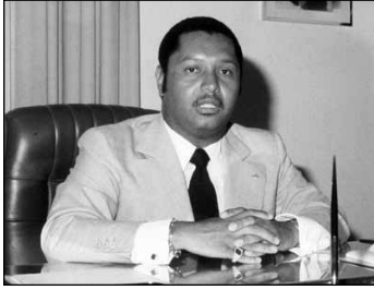
Jean-Claude Duvalier à Port-au-Prince en 1982

travers les tournées mondiales des troupes folkloriques privées et celles de la Troupe Folklorique Nationale, soit avec les voodoo shows produits dans les hôtels, Haïti connaissait alors un essor important du tourisme 2 .