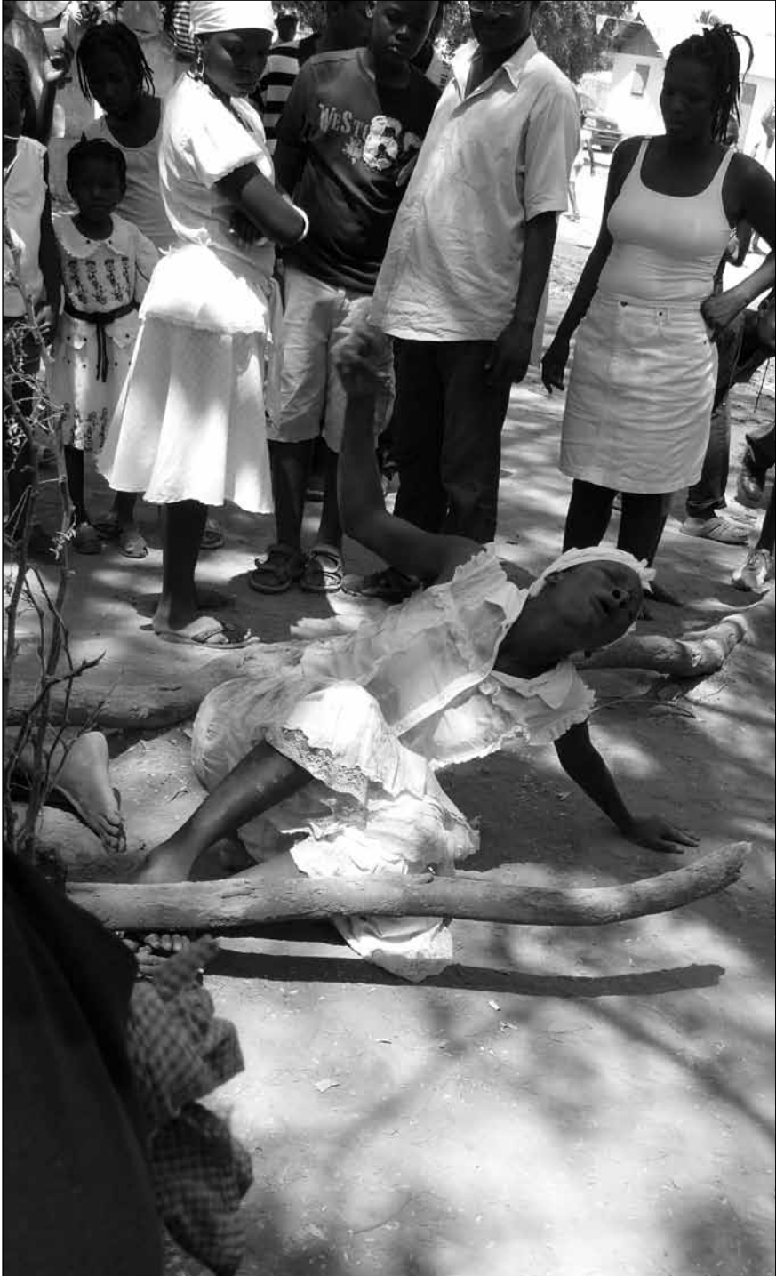
Scène de transe durant une cérémonie vodou.