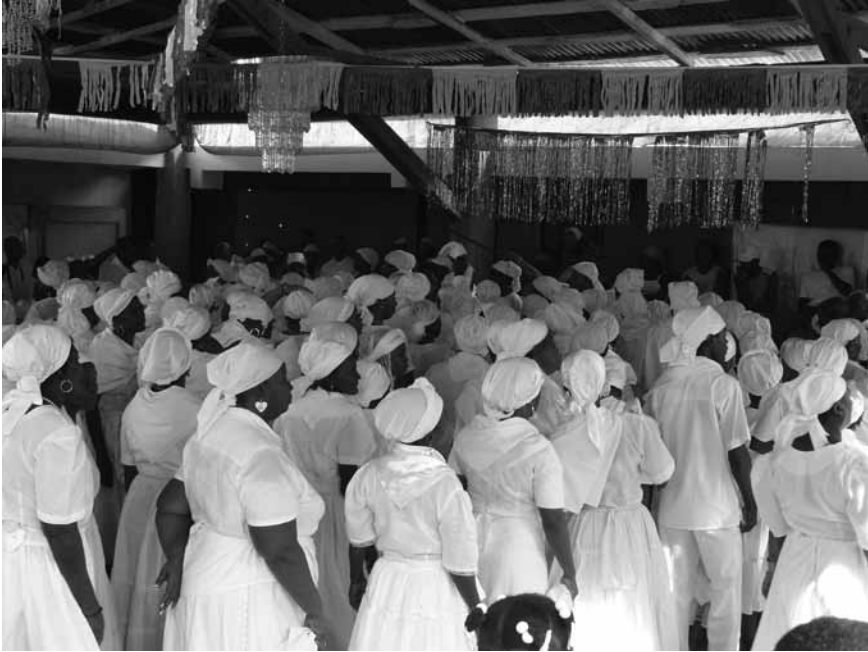
Cérémonie Vodou

de partenaire privilégié auprès des ONG des organisations de PVVIH [Personnes Vivant avec le VIH] et des institutions internationales. L'anthropologue Catherine Benoît a souligné la contradiction entre ce statut d'intermédiaire de la CONAVO dans la lutte contre le VIH dont le discours convainc les bailleurs internationaux, et les fantasmes que cet organisme véhicule au sujet de la relation entre les rituels vodou et la propagation de la pandémie 47 . Si les stéréotypes quant au rôle du vodou dans cette propagation persistent depuis le début de la pandémie 48 , ils correspondent cependant à la position de la CONAVO, car les sacrifices ont été proscrits des célébrations de l'Église Vodou d'Haïti. D'autre part, la CONAVO, les institutions internationales ainsi que la hiérarchie catholique 49 partagent une interprétation culturaliste du vodou : les serviteurs seraient des exécuteurs passifs «téléguidés» par leur culte. Cela légitime la présence, dans cette lutte contre le VIH-Sida, de la CONAVO et des associations vodou pour lesquelles la culture haïtienne serait toute entière portée par cette religion. Cependant, ces positions font l'impasse sur les conditions sociales, économiques et politiques