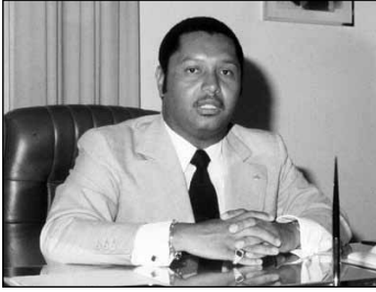
Jean-Claude Duvalier à Port-au-Prince en 1982

travers les tournées mondiales des troupes folkloriques privées et celles de la Troupe Folklorique Nationale, soit avec les voodoo shows produits dans les hôtels, Haïti connaissait alors un essor important du tourisme 2 .